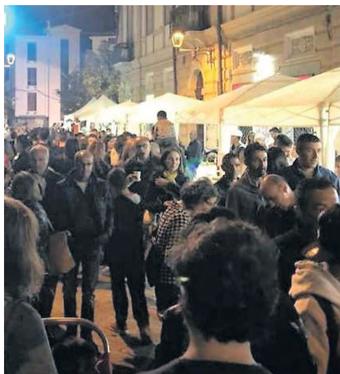
Un piatto di culurgionis proposto durante la manifestazione, a destra la folla che ha invaso le strade di Lanusei per visitare gli stand