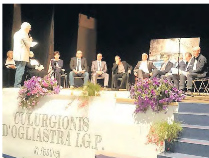
Un momento del convegno sul marchio Igp per i culurgiones

Lanusei, il contributo degli assessori regionali al Turismo e all'Agricoltura al Festival per il marchio Igp