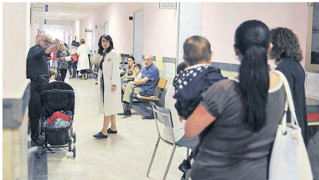
Genitori in attesa delle vaccinazioni per i bambini

«Non chiamateci No-vax: siamo solo genitori pieni di dubbi che hanno bisogno di avere informazioni precise per compiere scelte consapevoli e temono discriminazioni per i propri figli». La controversa vicenda dell'obbligatorietà delle vaccinazioni che sbarra le porte delle scuole ai bambini non vaccinati è approdata nella conferenza sociosanitaria territoriale dell'Ogliastra. Portavoce di un nutrito gruppo di genitori ogliastrini, che si sono organizzati in un movimento ribattezzato Modilis (acronimo che sta per Movimento diritti e libertà Sardegna), un papà che venerdì mattina a Lanusei, a margine dell'assemblea dei sindaci chiamata a discutere di sanità ospedaliera e territoriale, ha chiesto l'intervento degli amministratori. Svariate le motivazioni che hanno indotto questo genitore - che rimarrà anonimo per tutelare la privacy dei suoi bambini - a chiedere aiuto. «Ci preoccupano alcuni aspetti di una legge che riteniamo confusa e