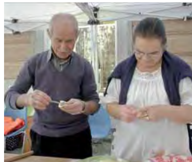
La chiusura dei culurgionis [E.L.]

ARZANA. Metà dei pazienti sardi vive in Ogliastra, costituita un'associazione